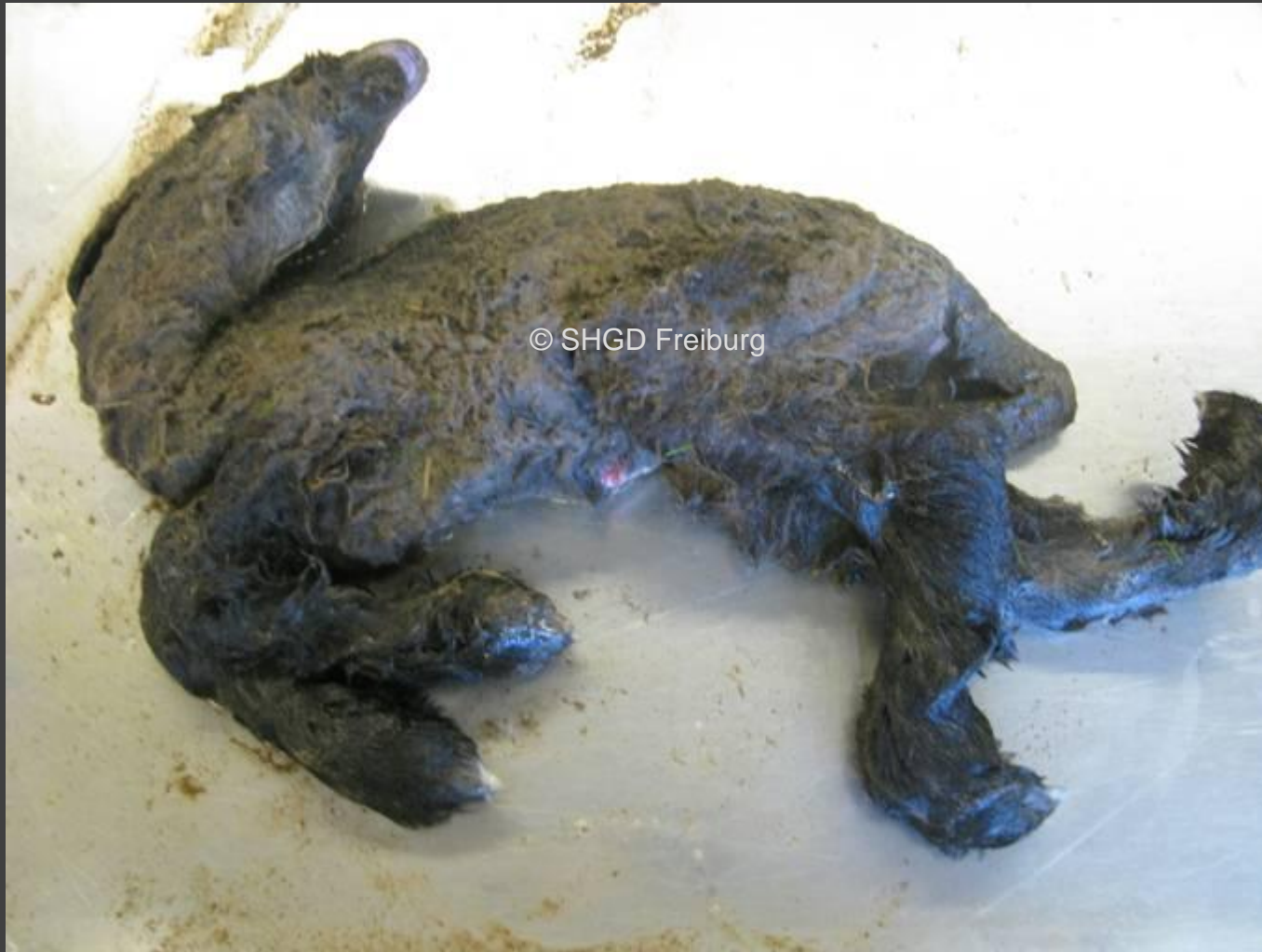
Schaflamm: Halsverkrümmung, Gelenksteife