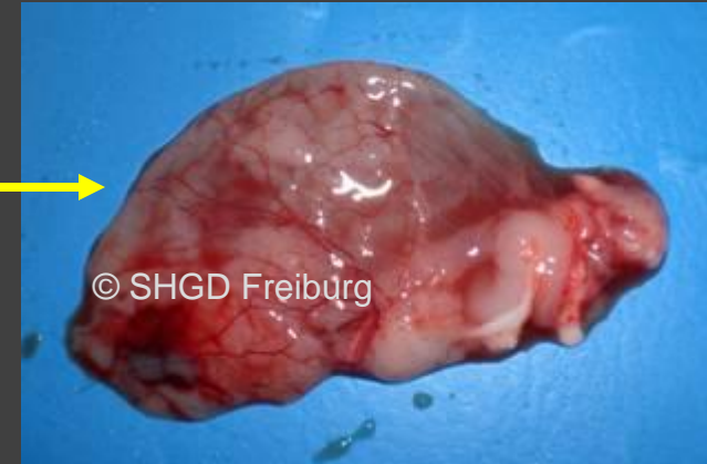
Ziegenlamm: Gehirnplasie (praktisch leere Schädelhöhle)