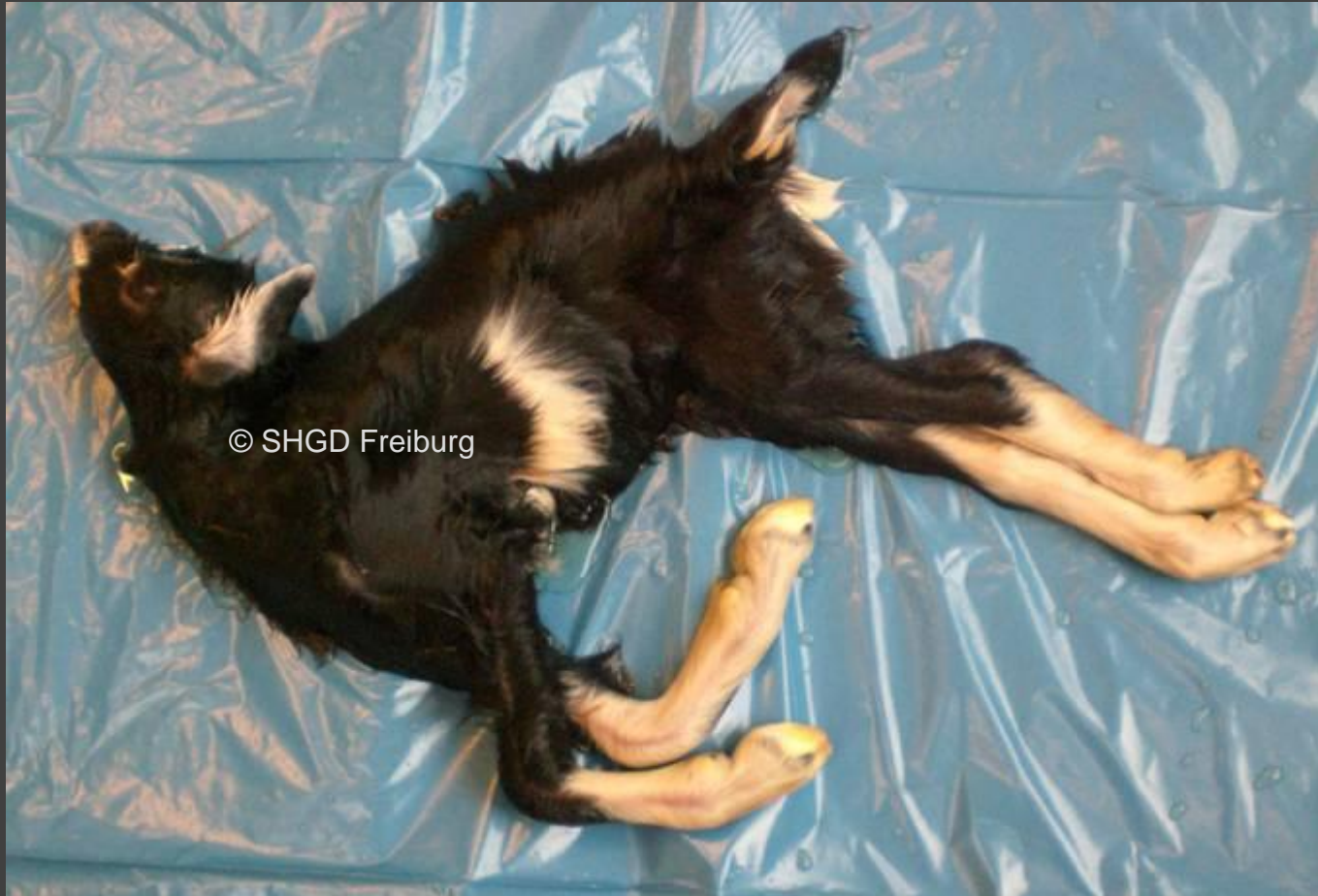
Ziegenlamm: Halsverkrümmung, Gelenksteife