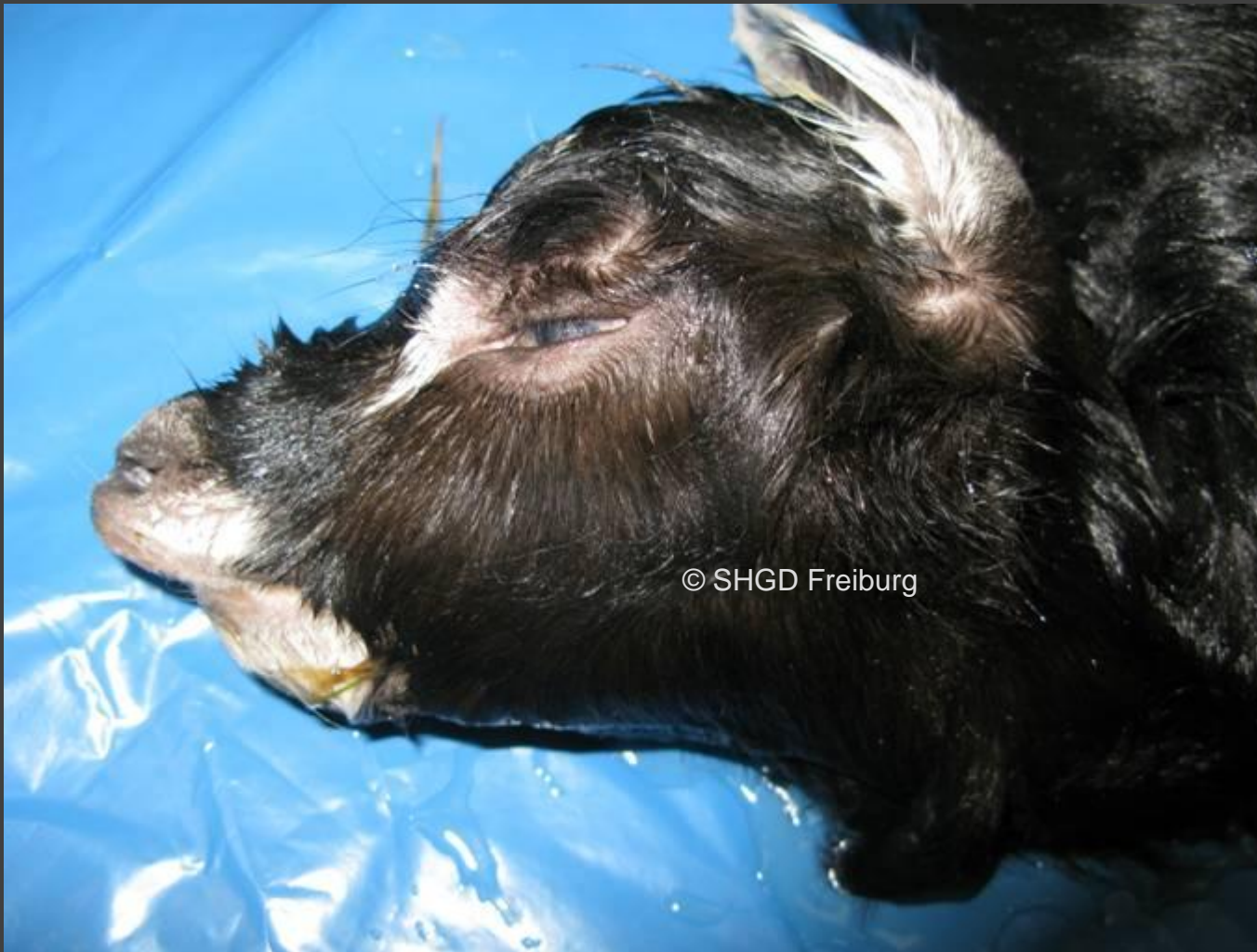
Ziegenlamm: Unterkiefer verkürzt