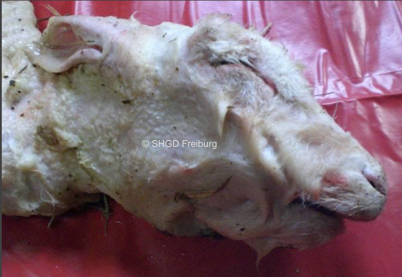
Schafkamm: Unterkiefer verkürzt