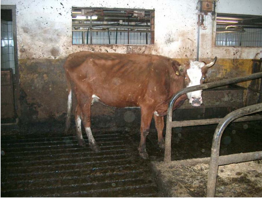
Seit längerer Zeit an Paratuberkulose erkrankte, abgemagerte Kuh