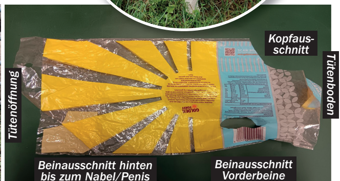
Schutzmantel aus Toastbrot-Tüte